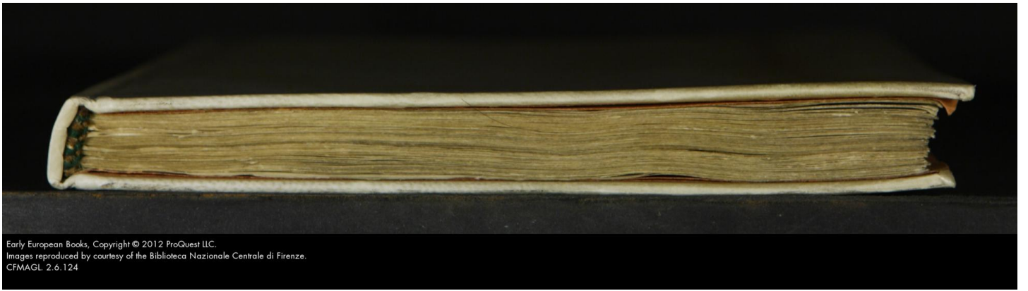
Early European Books, Copyright © 2012 ProQuest LLC. Images reproduced by courtesy of the Biblioteca Nazionale Centrale di Firenze. CFMAGL 2.6.124